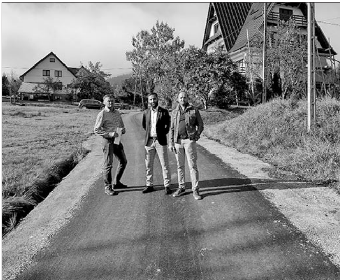
Zmodernizowana droga na os. Niedośpiąty Kasince Małej