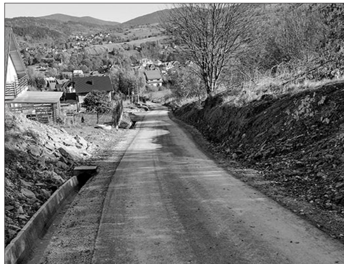
Zmodernizowana droga rolnicza Węglarze Dolne w Mszanie G.