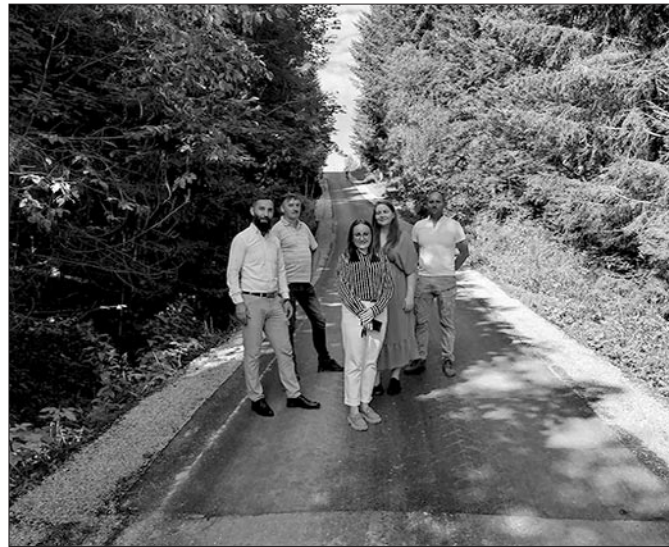
Wyremontowany stromy podjazd drogi do os. Zarębki Olszówce