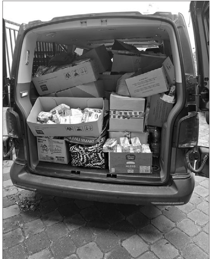
Transport z pomocą rzeczową dla powodzian