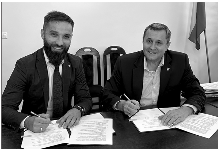
Podpisanie umowy „Razem Dla uczniów”

– Bardzo cieszy mnie, iż Gmina Raba Wyżna – Lider projektu wraz z Partnerem Gminą Mszana Dolna pozyskały dofinansowanie na realizację tak istotnych działań oświatowych. Każdy uczeń jest dla nas ważny, a szkoła powinna stwarzać równe szanse w dostępie do wiedzy, co wymaga czasem zastosowania