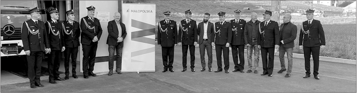
Wyremontowany plac manewrowy przy remizie OSP w Łętowie

Olszówki zwłaszcza w nadchodzącym sezonie jesienno – zimowym. W kolejnych latach planowana jest budowa pozostałych odcinków tej drogi. Remont wymienionego odcinka pochłonął 149 796,66 zł – środki własne gminy.