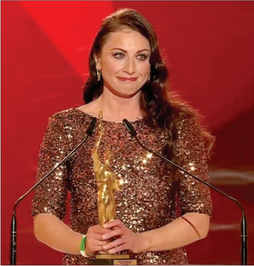
Justyna Kowalczyk-Tekieli, Ambasadorka Zagórzeńskich Dziedzin

Podczas sobotniej (9.01.20) Gali Mistrzów Sportu 2020 Justyna Kowalczyk-Tekieli, Ambasadorka Zagórzeńskich Dziedzin, otrzymała w 86. Plebiscycie „Przeglądu Sportowego” na najlepszego sportowca w Polsce statuetkę Superczempiona za całokształt kariery.