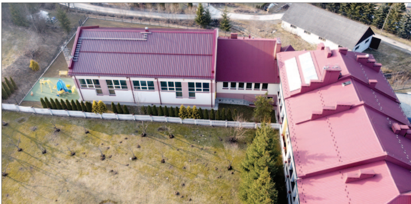
Szkola Podstawowa nr 2 w Mszanie Górnej z nową salą gimnastyczną