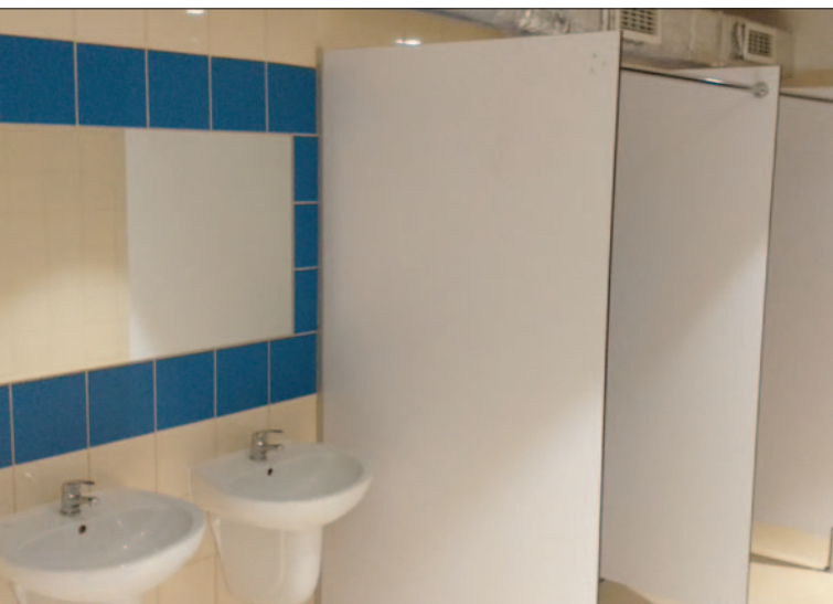
Nowe sanitariaty w szkole w Rabie Niżnej