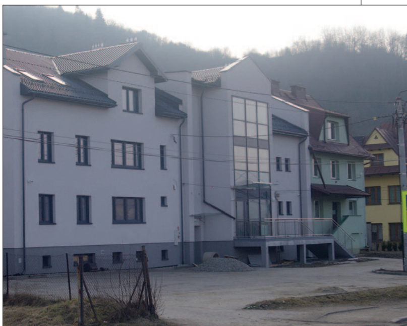
Ośrodek Zdrowia i ŚDS w Mszanie Górnej

Pracownicy Referatów: Inwestycji i Zamówień Publicznych oraz Gospodarki Komunalnej Ochrony Środowiska Rolnictwa i Leśnictwa Urzędu Gminy Mszana Dolna