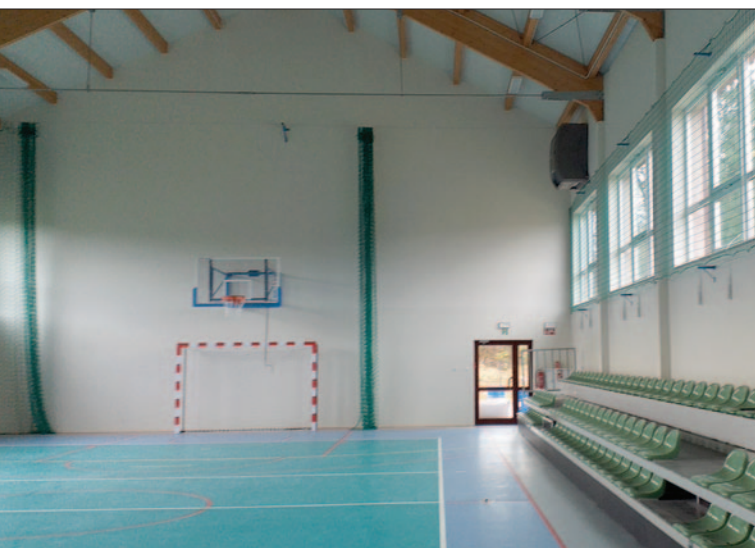
Sala gimnastyczna przy Szkole Podst. nr 2 w Mszanie Górnej

etapie planowania minęły zimowe miesiące w referacie inwestycji. Można je podsumować w następujący sposób: