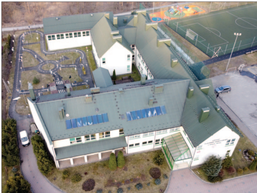
Nowy plac zabaw przy szkole Podstawowej nr 1 w Mszanie Górnej