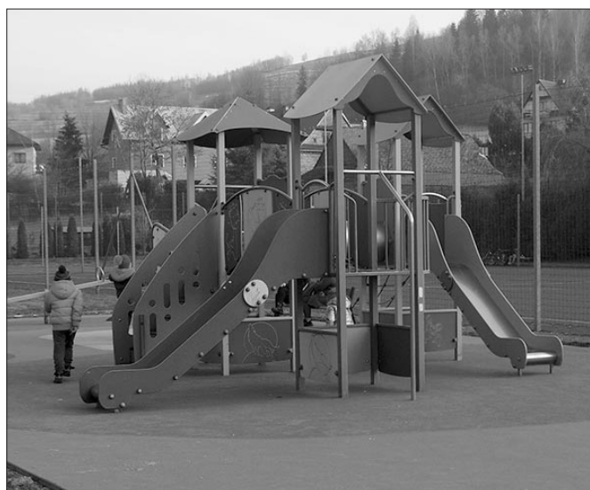
Plac zabaw w Mszanie Górnej SP1