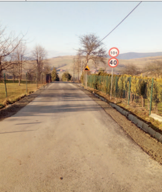
Droga do Osiedla Krzystki w Łętowem